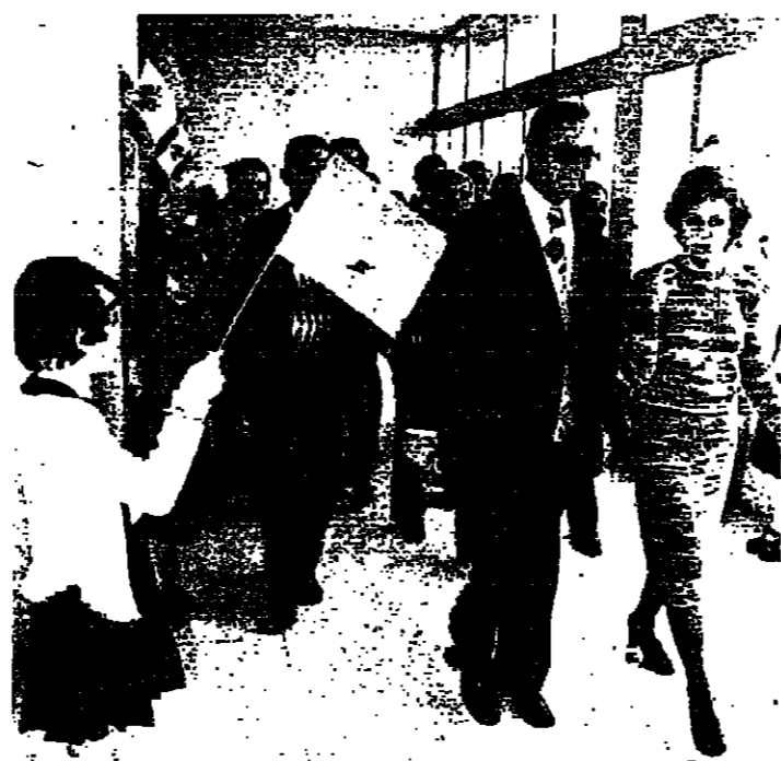
الحصن يدخل المؤسسة